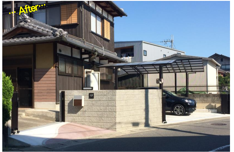
【敷地とカースペースにできた段差に門柱を作り、ポストを取付け。門扉を開けておけば、見知らぬ人も敷地内に入ることなく用を済ませられて安心です】