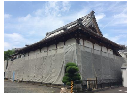
【大きなお堂に足場を組みます】

外壁に使用している耐久性のある焼杉でも、紫外線による色褪せは必至。結果、建物の美観と長持ちには4~5年に1度の塗装が必要となります。サイディングの場合は10~15年が塗替えの目安。今後の保守を考え、より手間のかからないサイディングに張替えされることとなりました。