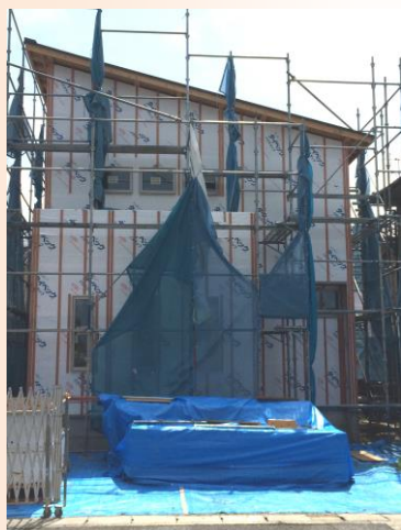
【道路側から見た外観現段階】