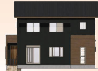
【南側から見た完成イメージ】

6月から始まった新築工事。引き締まった印象の黒を基調に、木目のサイディングをアクセントに入れて建物に立体感を持たせています。シャープな