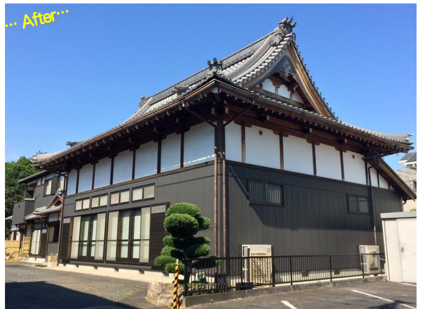
【重量感のある色合いで、防水・耐久性に優れた窯業サイディングに】