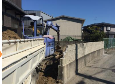
【道路添いのブロック塀を壊すと敷地に段差が...】