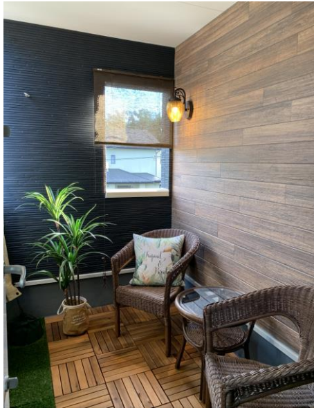
【バルコニーは読書を楽しむ異空間】

まるでモデルルームのようなインテリア。家具から小物まで“場所に合ったもの”をチョイスして配置され、無駄なものはない様にされています。欲しい物があれば、今あるものを一つ処分する・・・という考えのもと、空間自体を綺麗に保つのを基本に毎日を心豊かに過ごされています☆