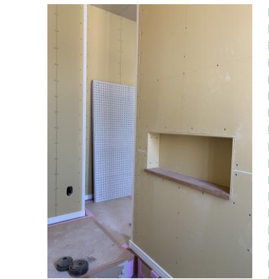
【玄関には鍵置き用ニッチを】