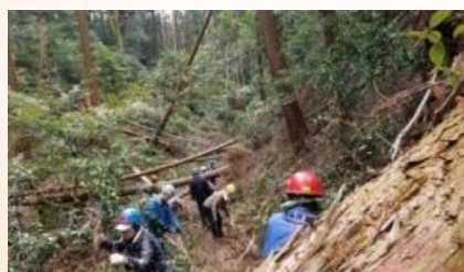
【みんなで頑張って整備をしました】