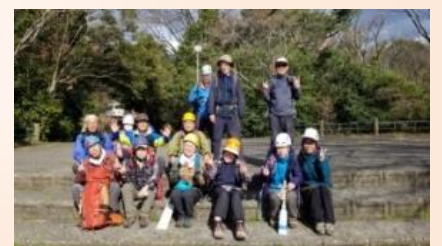
【この時の参加者です。みんな「やったね」と笑顔です】