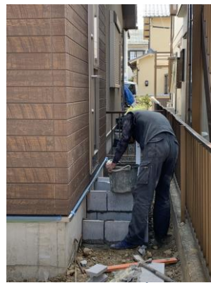
【勝手口にステップ階段を】