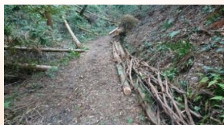
【こんなに綺麗になりました。この日は50m程整備できました】