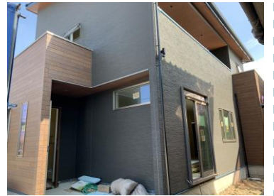
【足場も取れて現れた外観】

新築工事の完成も間近となってきました。内部の造作も終わり、クロス貼りに入ります。クロスは、下地にへこみや穴があると仕上がりに影響します。ボードのつなぎ目など“パテ”ですき間を埋め、乾いたらサンダーで厚みの出た箇所を削り、平坦にならしてからクロスを貼ります。