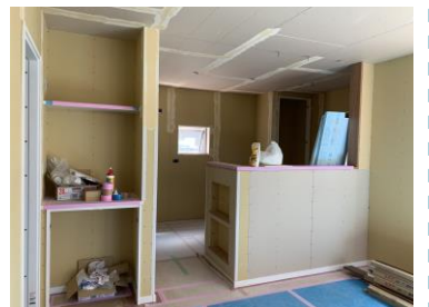
【雑誌収納をキッチン横壁に造作】